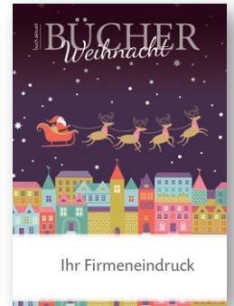
illustrative Titelvariante 2016