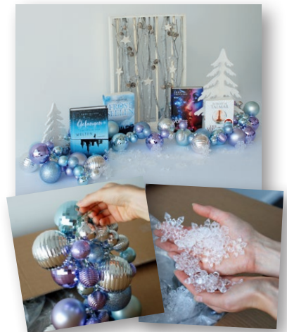
Dekopaket 2016, ohne Beispielbücher